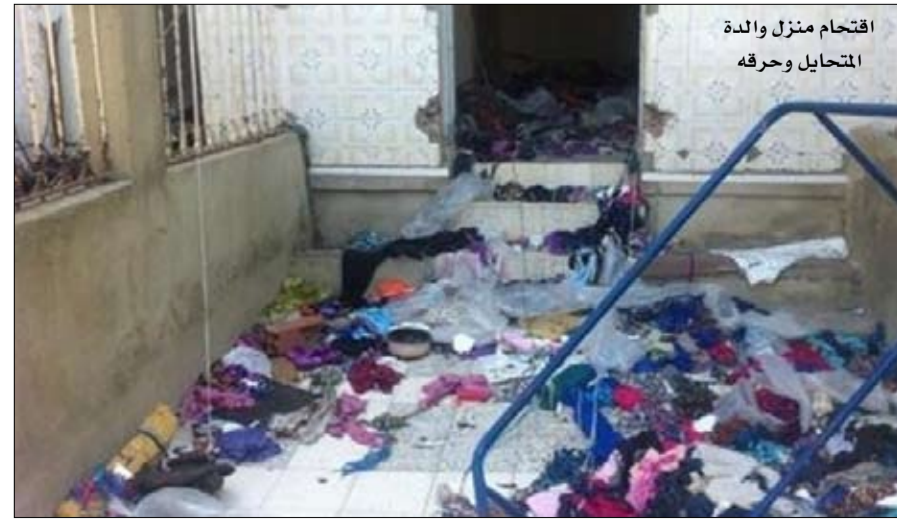
اقتحام منزل والدة المتحيل وحرقه

تحويل أخرى كبرى لم يتم التفتن إليها بعد، وهي عمليات لم تشملها التحريات وفق تعبيره. وأضاف الجودي المتحيلون عادة ما يختارون الفترات الانتقالية التي تغيب فيها هيكل الدولة، وحمل الخبير الاقتصادي المسؤول إلى المواطن بدرجة أولى الذي بحث عن الربح السريع دون التثبت والاستقصاء. كما محل المسؤولية في درجة ثانية إلى الدولة التي بيدها هيكل الرقابة والتي يحق لها مراقبة مثل هذه الشركات على غرار الوزارة الأولى والوزارات المعنية والبنك المركزي الذي مهمته مراقبة كل نشاط مالي وينبغي في تونس.