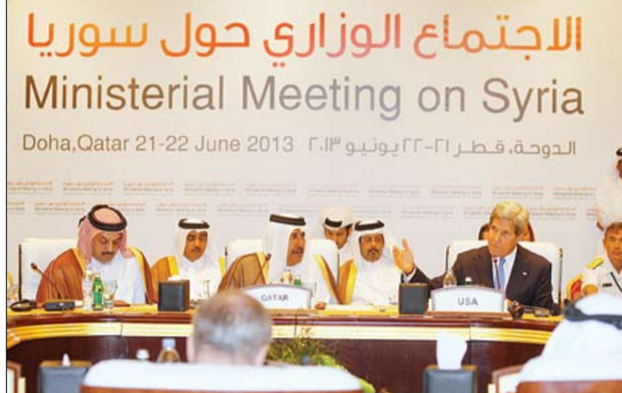
كيري وحمد بن جاسم خلال الاجتماع الوزاري حول سوريا في الدوحة