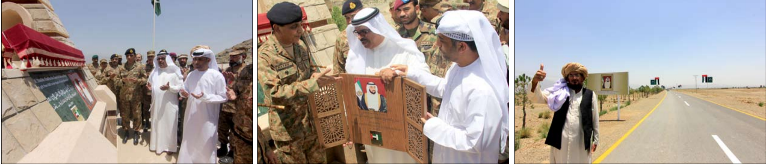
بتوجيهات رئيس الدولة

في شرق السودان ومشاريع تعليمية وأخرى خدمية في مجال المياه وحفر آبار مياه الشرب في منطقة شرق السودان. مضيفة أن الوفد اطلع على المشاريع التنموية التي يجري تنفيذها من قبل الهيئة في مناطق البكتاري شمال شرق السودان والوادي الأخضر بمدينة أم درمان وقرية الصحفيين. وقد تعرف وفد الهيئة خلال ورشة العمل التي عقدت بجمعية الهلال الأحمر السوداني في الخرطوم على خطط الجمعية في تنفيذ المشاريع الإنشائية والدعم النفسي الذي تقدمه الجمعية للكثير من المنكوبين والمتضررين من الكوارث بالسودان كما اطلع على تقرير حول متابعة جمعية الهلال الأحمر السوداني لأوضاع الأيتام المكفولين بالسودان من قبل المحسنين بدولة الإمارات العربية المتحدة بعد أن أسندت لهم الهيئة رعاية أيتام السودان ومتابعة صرف مستحقاتهم ورعايتهم.