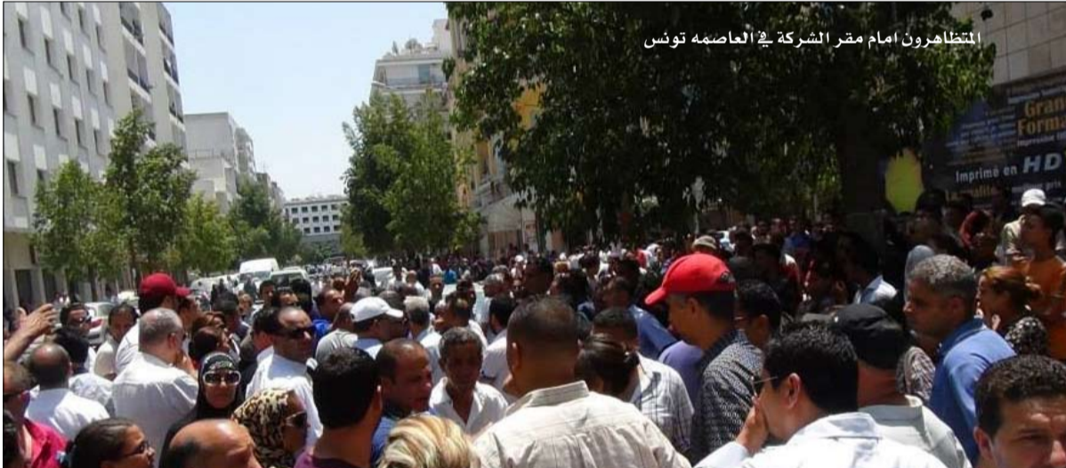
التظاهرون امام مقر الشركة في العاصمة تونس

العاجلة ويراهن كثيرون على هذا التقارب بين الجبهتين لتحقيق التوازن السياسي وربما تحقيق التغيير بعد الانتخابات