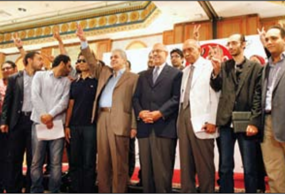
قادة المعارضة خلال مؤتمر صحفي في القاهرة