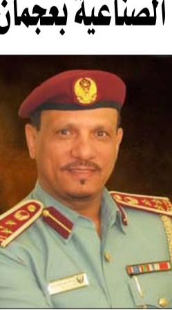
•• عجمان - محمد بدير تمكن رجال الدفاع المدني بعجمان من إخماد حريق والسيطرة عليه كان قد نشب في الساعة 12 و 55 دقيقة ظهرا يوم أمس ، في احد مصانع البلاستيك والمواد الجلدية في المنطقة الصناعية بعجمان . وأكد العميد صالح سعيد المطروشي مدير عام إدارة الدفاع المدني بعجمان، الذي أشرف على عمليات الإطفاء، إن الحريق لم ينجم عنه إصابات بشرية، مؤكدا أن السيطرة تمت على الحريق في غضون 45 دقيقة، ومن ثم بدأت عمليات التبريد، كي لا تشب النيران مرة أخرى، أو تنتقل إلى مكان آخر، خصوصا أن مصنع محاط بالعديد من المصانع والمستودعات العاملة في المشتقات البترولية والمواد البلاستيكية والمواد الجلدية، وقد شارك 3 مركبات لاشتباحت في عمليات الإطفاء والتبريد، هي