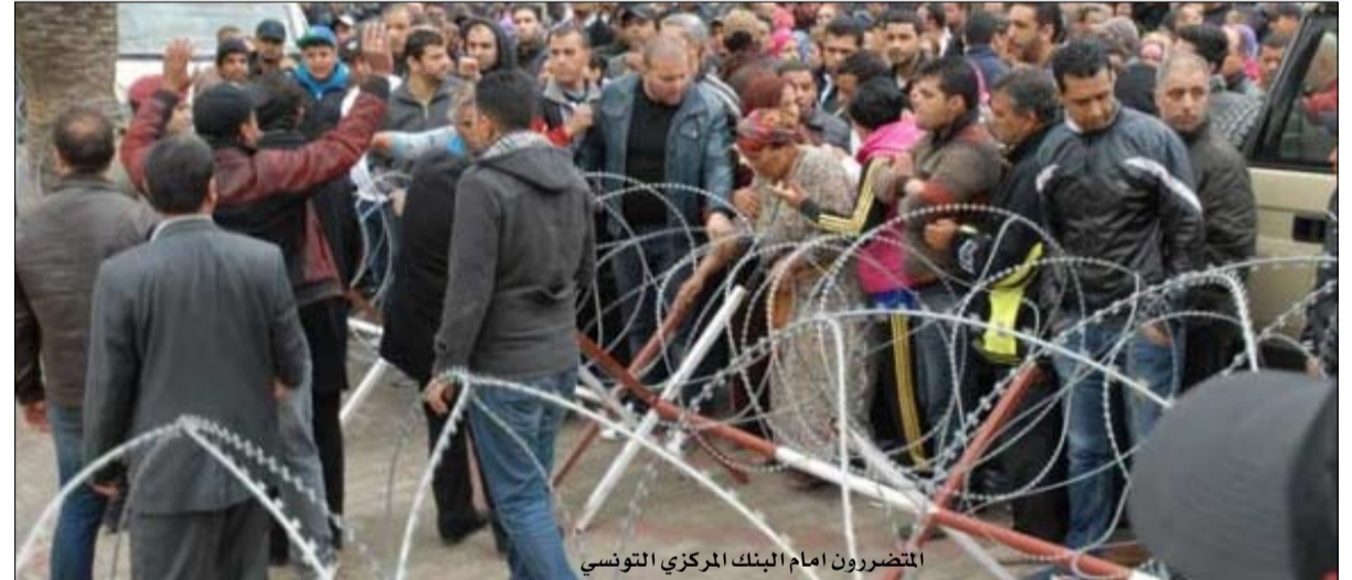
المتضررون امام البنك المركزي التونسي